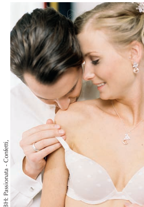
BH: Passionata - Coniètti,