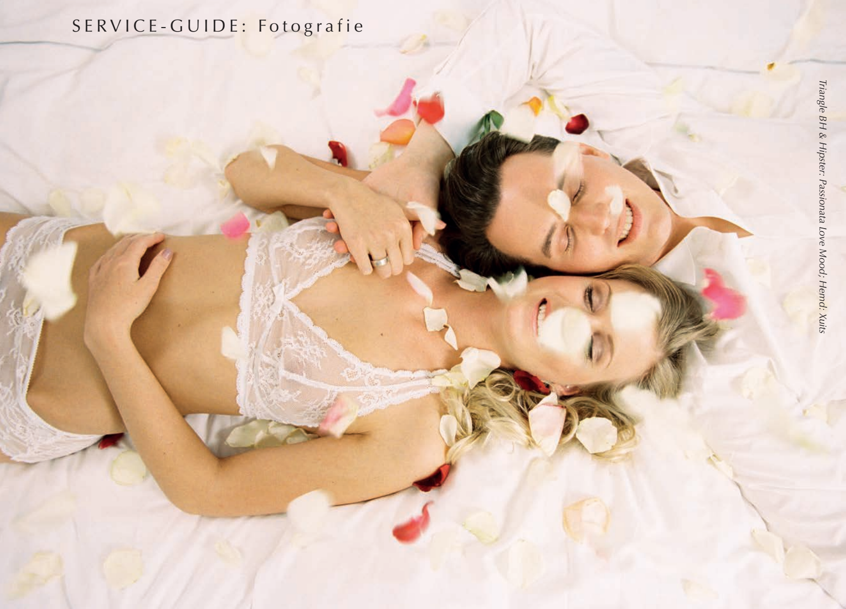
Triangle BH & Hipster: Passionata Love Mood; Hemd: Xuits